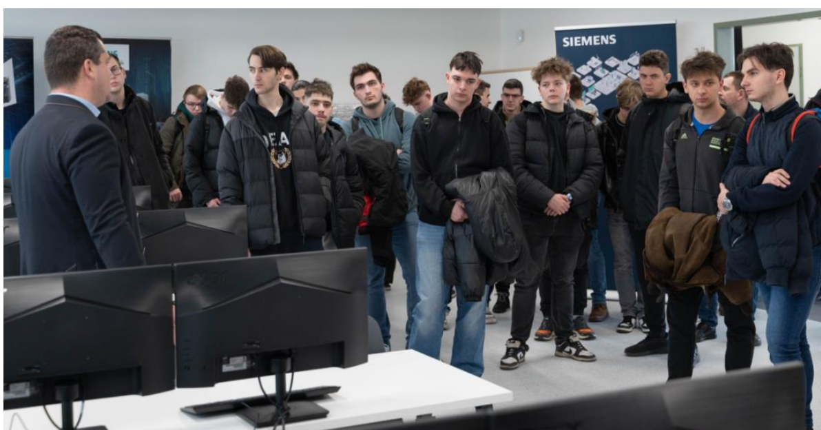
Mechwartos diákok a Debreceni SZC Mechwart András Gépipari és Informatikai Technikum karrierhetének keretében, a Debreceni Egyetem Műszaki Kara laboratóriumában

Az előadások meghallgatása után a tanulók kérdéseket tehetek fel az előadóknak, majd megtekinthették a kar korszerű laboratóriumait. (Szerk.)