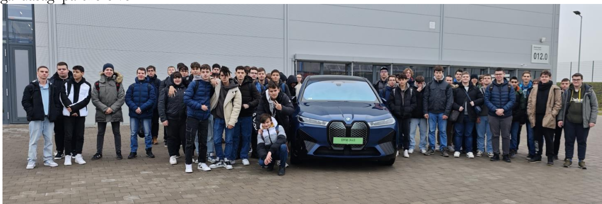
10. évfolyamos mechwartos tanulók a BMW gyár képzési központja előtt Debrecenben, az 5. Járműipari nyílt napon

A tanulók már a 9. 10. évfolyamon tájékozódhatnak a lehetőségekről. Az üzemlátogatások, különböző szakmairendezvények alkalmával találkozhatnak iskolánk duális képzésben résztvevő gazdasági partnereivel.